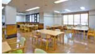
レクリエーションルーム