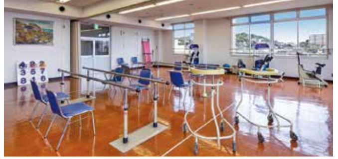
広々としたリハビリテーションルーム